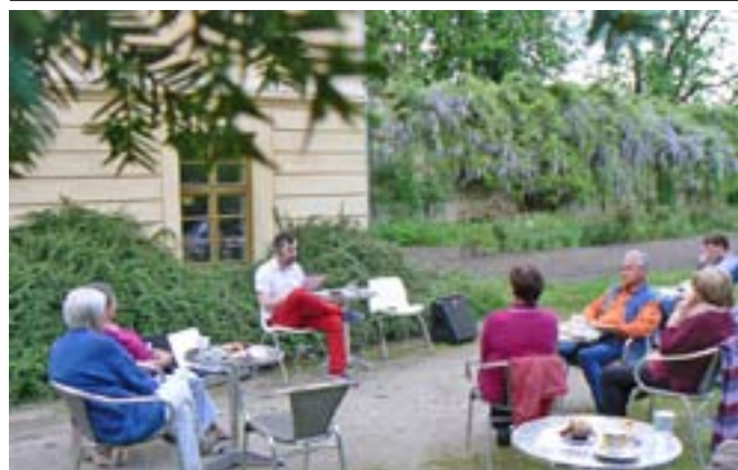
Noc literatury letos proběhla v zámeckém parku.