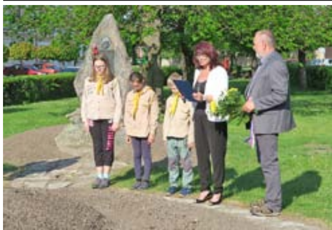
Z pietního aktu.