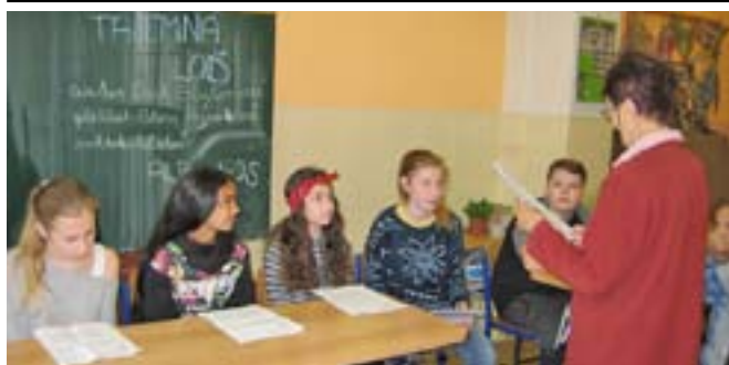
Začínáme! Příprava na nahrávání.

Audiokniha je prima! To je název projektu, na který získala Městská knihovna Opočno dotaci od Ministerstva kultury z dotačního programu Knihovna 21. století. A o co vlastně jde?